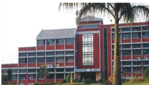
BHAGWANT INSTITUTE OF PHARMACY MUZAFFARNAGAR (UP)