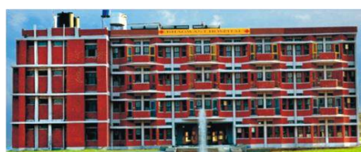
BHAGWANT AYURVEDIC COLLEGE MUZAFFARNAGAR(UP)