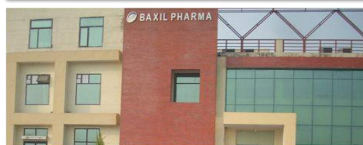
BAXIL PHARMACEUTICALS HARIDWAR (UK)