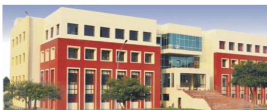
BHAGWANT INSTITUTE OF MEDICAL SCIENCES, MUZAFFARNAGAR (UP)