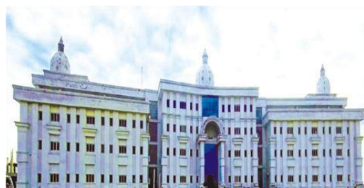
BHAGWANT GLOBAL UNIVERSITY KOTDWAR (U.K)