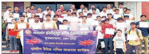
बीआईटी की गणित कार्यशाला के समापन पर उपस्थित छात्र-छात्रा।

डा. दिव्या ने छात्रों को मार्गदर्शित कर इस कार्यशाला में छात्रों को मैथमैटिक्स की शॉर्ट ट्रिक्स सिखाई, जिससे मैथ की