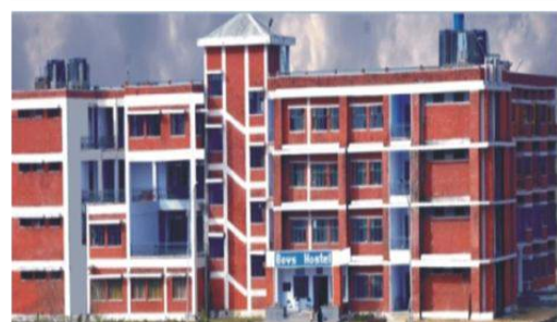
BHAGWANT COLLEGE OF PHARMACY MUZAFFARNAGAR (UP)