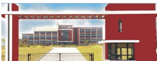
BHAGWANT INSTITUTE OF TECHNOLOGY MUZAFFARNAGAR (UP)