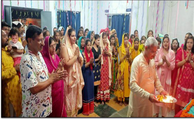
बीआईटी में चल रही भजन संध्या में हुआ डांडिए का आयोजन

The legend associated with Navratri speaks about the great battle between the powerful demon Mahishasura and Goddess Durga. Each year, on day of Navratri, an incarnation of “Goddess Durga” is worshipped to celebrate the day of her victory over Mahishasura, and the ultimate victory of 'Good over Evil.’