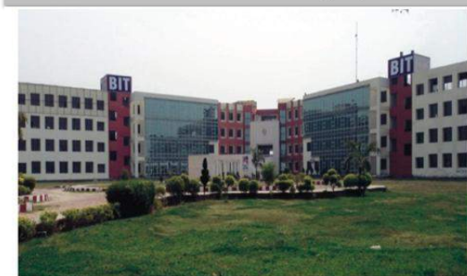
BHAGWANT INSTITUTE OF TECHNOLOGY GHAZIABAD (UP)