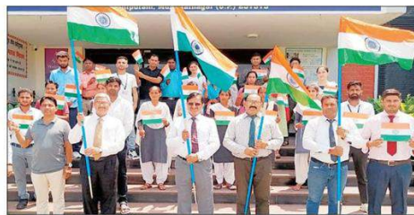
विजनीर बीआईटी में तिरंगा यात्रा निकालते प्राध्यापक।

बीआईटी के पैदल मार्च में मां भारती के नारों के साथ यह यात्रा बीआईटी से शुरू होकर कासमपुर खोला तक गई। इस यात्रा के माध्यम से विभाजन विभीषिका स्मृति दिवस की याद में इस विषय पर मंथन किया गया। विभाजन उपरांत भारत से अलग हुए क्षेत्रों के संदर्भ में अवगत कराया गया। इस विभाजन से हमारे देश को कितना नुकसान