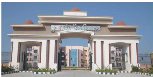
BHAGWANT UNIVERSITY, AJMER (RAJASTHAN)