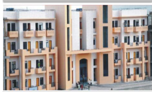
BHAGWANT COLLEGE OF EDUCATION MUZAFFARNAGAR (UP)